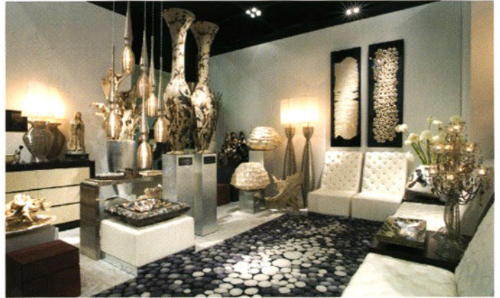
Veel verschillende wit tinten, platina, champagne en gouden kleuren op de stand van DK Home.

'Voor DK Home is dit een zeer goede beurs geweest. Er zijn directe orders geplaatst, maar we hebben ook weer veel van onze vaste klanten en projectklanten mogen begroeten zoals hotels en restaurants waar