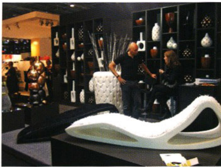
De stand van Gutz, met op de voorgrond de B'kini Chair ontworpen door Wiel Arets