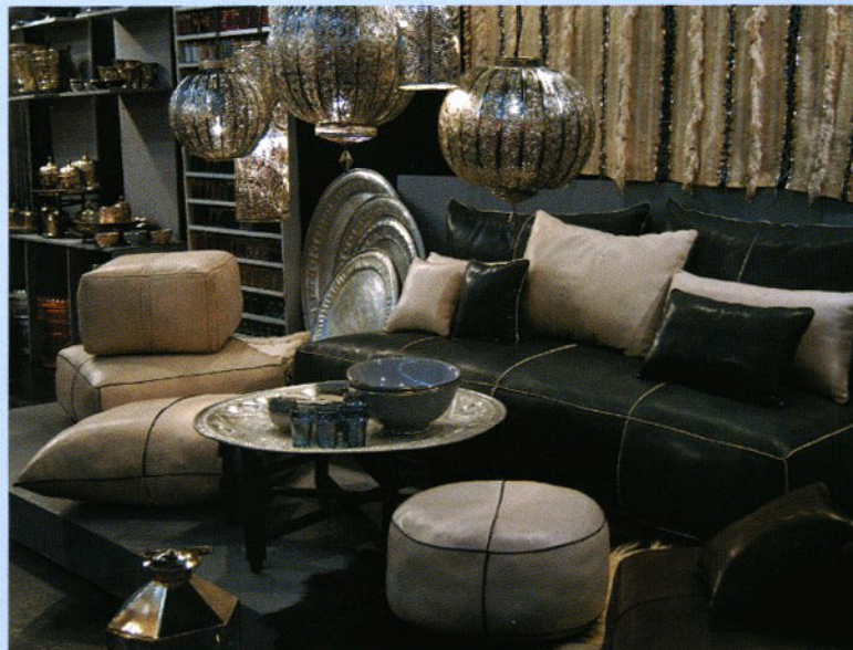
De stand van Khmissa Marocco Design

De volgende Tendance (met de naam Frankfurt 4 all Seasons) vindt plaats van 4 tot en met 8 juli 2008.